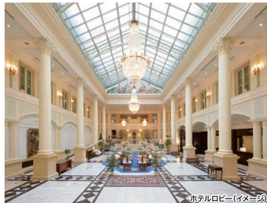
ホテルロビー(イメージ)

HOTEL DATA IN 15:00 OUT 11:00 朝食 和洋ビュッフェ/レストラン