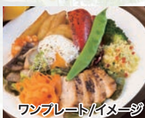
ワンピースセット/イメージ