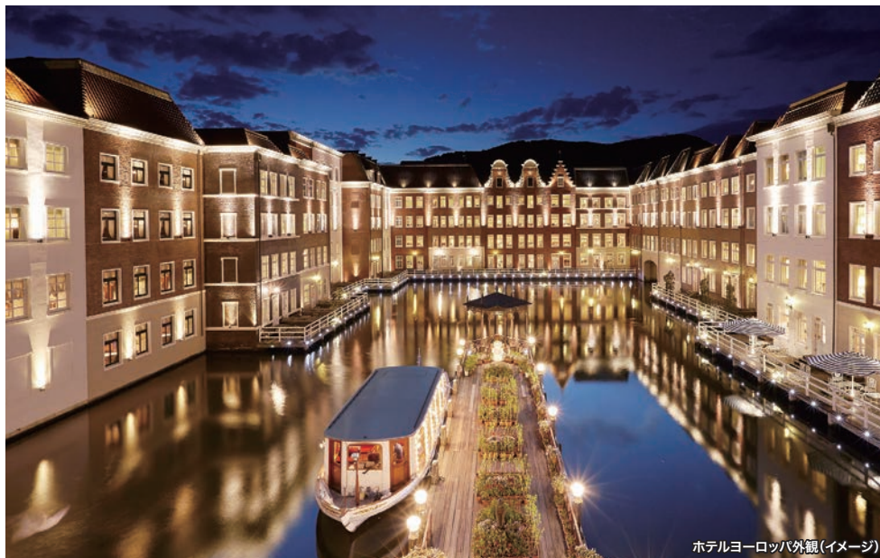
ホテルヨーロッパ外観(イメージ)