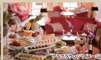
クラブラウンジ(イメージ)