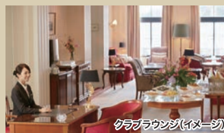
クラブラウンジ(イメージ)