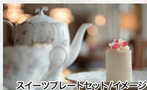
スイーツプレートセット/イメージ