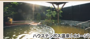
ハウステンボス温泉(イメージ)