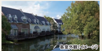
客室外観(イメージ)