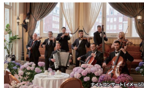
ナイトコンサート(イメージ)