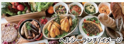
ヘルシーランチ/イメージ

厳選した九州近郊の 食材を使用した料理 をbuffetスタイルで ご用意します。