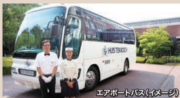
エアポートバス(イメージ)

※ホテル公式ホームページより事前予約制(先着順) ※日との併用不可 ※詳細はパンフレット裏面をご覧ください