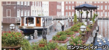
ボートツアー(イメージ)