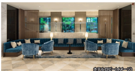
ホテルロビー(イメージ)