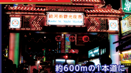
3日目★(注5) 饒河街夜市

約600mの1本道に「衣・食・遊」様々な夜店が軒を連ねる若者に人気のスポットです