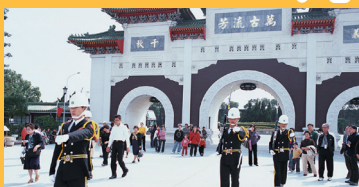
ちゅうれつし 忠烈祠(注2)