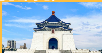
ちゅうせいきねんどう 中正記念堂