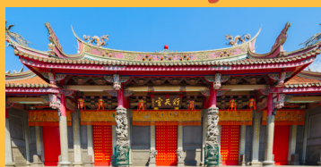
ぎょうてんぐう 行天宮