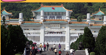
こきゅうはくぶつじん 故宮博物院(注3)