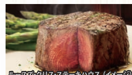
ルースズ・クリス・ステーキハウス (イメージ)

●アウアナ鑑賞場所: アウトリガー・ワイキキ・ビーチコマース・ホテル 2階ロビー 劇場入口