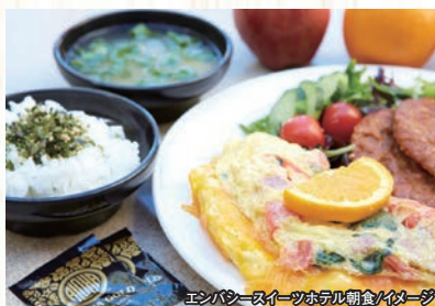
エンパシススイーツホテル朝食/イメージ

●利用時間: 06:30~09:30 (土・日曜は~10:30) (利用時間・メニューはホテルにより異なります。)