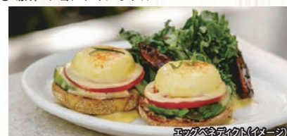
エッグベネディクト/イメージ

(※1) ホリディインエクスプレス、エンパシススイーツバイヒルトンワイキキビーチウォークにご宿泊の場合はホテルでの毎朝食となります。