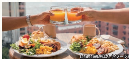
LeaLea朝ごはん (イメージ)

●場所: ワイキキビジネスプラザ19階スカイワイキキ内 カラカウアデッキ ※雨天時は屋内となります。