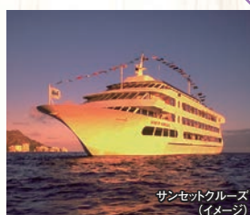
サンセットクルーズ (イメージ)