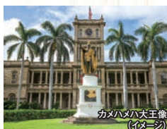
カモハメレ大王像 (イメージ)