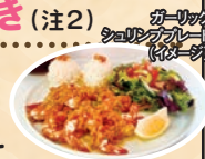
ガーリックシュリンプ(イメージ)

新スポット ハワイ発 唯一無二のエンターテイメント シルク・ドゥ・ソレイユ アウアナ