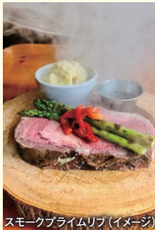
スモークブライムリブ(イメージ)

【ご案内】○航空座席・ホテルがすべてお取りでき申込書の提出、お申込金をご入金頂いていることが条件となります。○キャンペーン終了後の変更(コース・氏名変更・訂正・参加者交代・日程変更)をされた場合は商品を一度お取消しいただき、特典なしで再契約となります。添い寝のお子様、幼児は対象外となります。