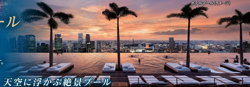
ホテルプール(イメージ)