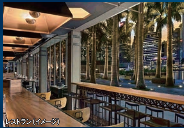
レストラン(イメージ)