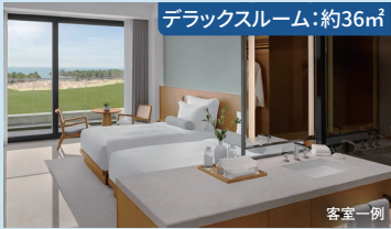
デラックスルーム:約36㎡