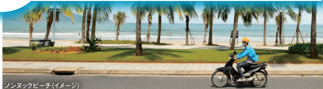
ノンヌックビーチ (イメージ)