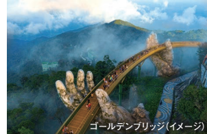
ゴールデンブリッジ (イメージ)

<条件> ■最少催行人員:1名 ■所要時間:約7時間 (8時～15時頃) ■食事:昼食 ■コード: BANAL/EB45 ■運行事業者: SKYhub VIETNAM ■取消料発生日: 催行日の20日前より100%