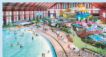
ウォーターパーク(イメージ)

日本文化を楽しめるリゾートホテル。波のプールやスライダーもあるウォーターパークは、年中天候に左右されず楽しめます。市街地からは少し離れますが、その分ホテルで思いっきりお楽しみいただけます。