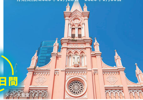
ダナン大聖堂 (イメージ)