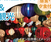
ホイアン旧市街 (イメージ)

<条件> ■最少催行人員:1名 ■所要時間:約12時間半 (8時半～21時頃) ■食事:昼食・夕食 ■コード: CENFL/EB45 ■運行事業者: SKYhub VIETNAM ■取消料発生日: 催行日の20日前より100%