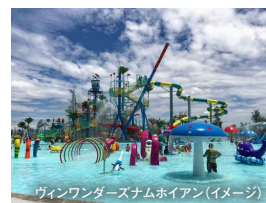
ヴィンワンダーズナムホイアン (イメージ)

<条件> ■最少催行人員:1名 ■所要時間:約9時間 (8時～17時頃) ■食事:昼食 ■コード: VPL01/EB45 ■運行事業者: SKYhub VIETNAM ■取消料発生日: 催行日の20日前より100% ※ウォーターパーク利用の際は水着・タオルはご持参ください