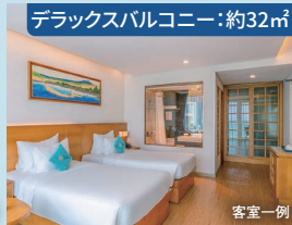
デラックスバルコニー:約32㎡