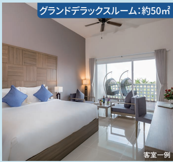
グランドデラックスルーム:約50㎡