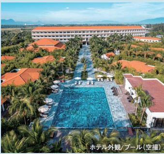
ホテル外観/プール(空撮)

ダナンとホイアンの間に位置し、ホテルの目の前には美しいビーチが広がる日系リゾートホテル。客室は50㎡と広々、ホテルには大浴場も備わり、ホテル宿泊者は無料でご利用いただけます。