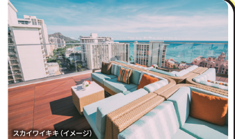
スカイワイキキ(イメージ)