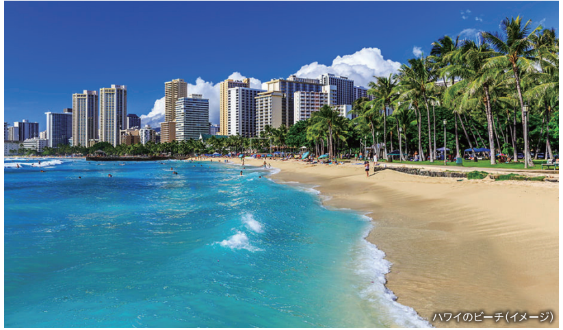
ハワイのビーチ(イメージ)